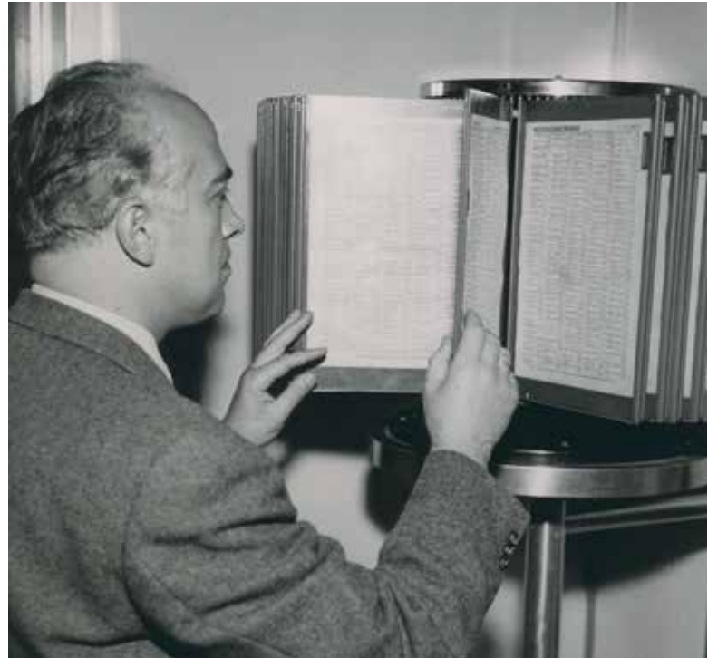
Zu Zeiten, als weder jeder ein Telefon noch ein Telefonbuch hatte, konnte man die einzelnen Seiten auf dem Postamt einsehen wie hier in Wuppertal

gibt es längst keine Eintragungspflicht mehr. Derzeit erscheinen jährlich bundesweit 141 Ausgaben von Das Telefonbuch. In der Gesamtauflage von 28 Millionen Exemplaren sind die Daten von rund 30 Millionen Teilnehmern zu finden. 50 Millionen Deutsche nutzen es. Die Onlineausgabe hat bereits etwa 80 Millionen Seitenaufrufe pro Monat. Müller, Schmidt, Fischer und Weber sind die Nachnamen, nach denen hier am häufigsten gesucht wird, aber auch nach Politprominenz wie „Gauck“ und den