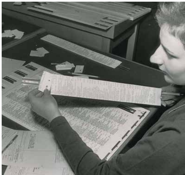
Die Mitarbeiterin der Deutschen Bundespost beim Einarbeiten von neuen Adressen für das Telefonbuch in die so genannte Schuppendatei

Man muss kein Künstler sein, um den vielseitigen Nutzen von Telefonbüchern für sich zu entdecken. In den Vereinigten Staaten, wo es noch vielerorts die Regel ist, dass Telefonbücher ungefragt zugestellt werden, sodass sie sich in den Lobbys zu Türmen stapeln, andererseits die Armut viele Menschen zum Sparen zwingt, gibt es im Internet Tipps, wie ausrangierte Telefonbücher verwendet werden können. So ergeben 16 Exemplare einen stabilen Ständer für den Laptop, und eines macht sich gut als Türstopper. Im Hotelzimmer dient ein Telefonbuch als