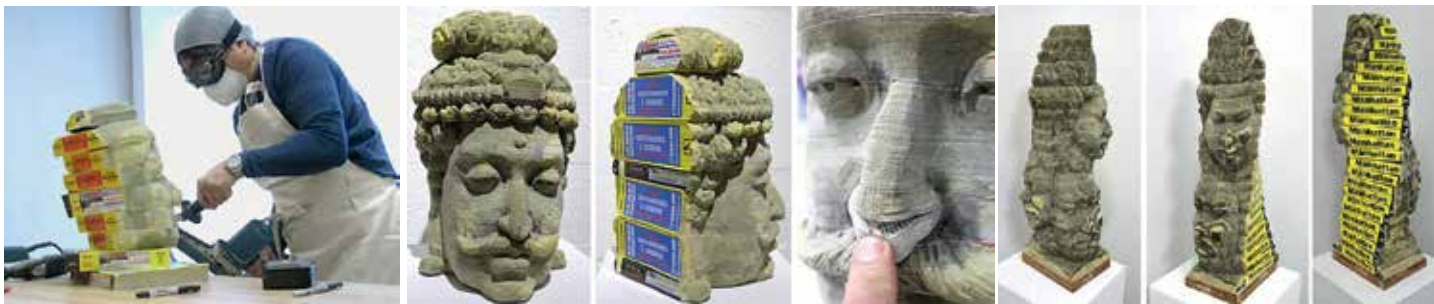
Der taiwanische Künstler Long-Bin Chen sägt seit den 1990er-Jahren Skulpturen aus alten Telefonbüchern, Zeitungen oder Magazinen. Die Fertigkeiten dafür hat er sich selbst beigebracht